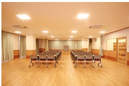
(地域交流センター)